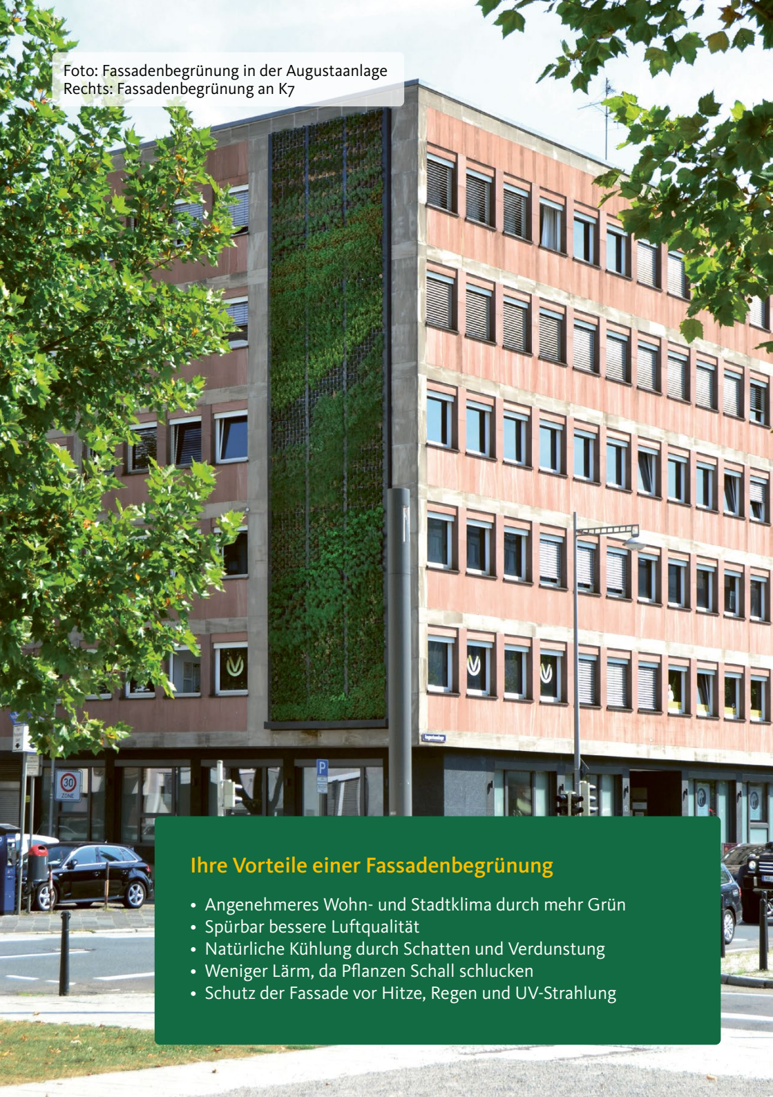
Foto: Fassadenbegrünung in der Augustaanlage Rechts: Fassadenbegrünung an K7